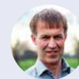
ARIE ACHTERSTRAAT Gemeentelijke Afdeling SGP Ede

Voor u verder leest in deze Klanken nog één vraag: Is God afhankelijk van mensen of zijn mensen afhankelijk van God?