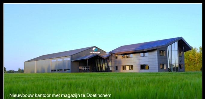
Nieuwbouw kantoor met magazijn te Doetinchem