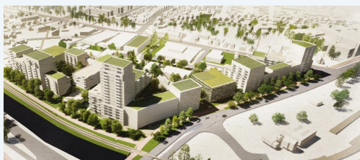
Illustratie: Bureau Rijnboutt