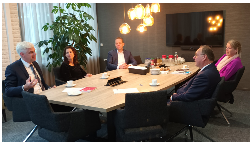
In de achterliggende periode hebben we weer verschillende werkbezoeken in het onderwijs en de jeugdzorg gedaan. Een ervan was een bezoek aan de Jacobus Fruytier scholengemeenschap. We hadden goede gesprekken met de directie, de afdeling zorg, conciërges en leerlingen uit de medezeggenschapsraad.

De bedoeling is dat het plan binnenkort met de raad wordt besproken. Hopelijk is er steun voor een evenwichtige aanpak richting een duurzame toekomst voor de agrarische sector. Want de impact reikt verder dan alleen het boerenbedrijf. De sector vormt het landschap, beïnvloedt