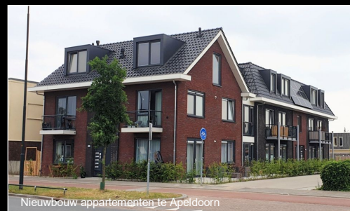
Nieuwbouw appartementen te Apeldoorn

Wilmersdorf 29 055 - 760 1111 Apeldoorn info@aartbouman.nl