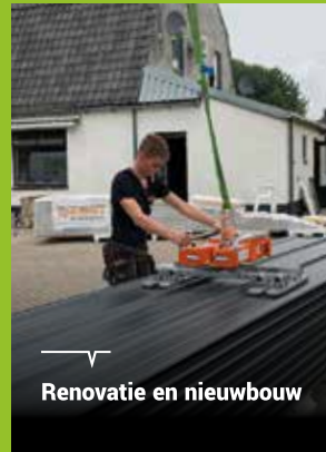
Renovatie en nieuwbouw