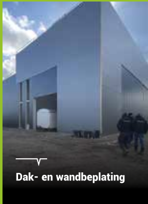
Dak- en wandbeplating