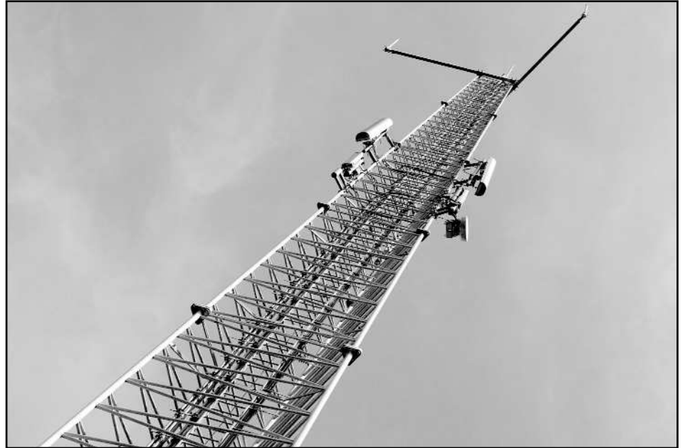
Antennemasten staan in de steden vaak op hoge gebouwen.

schorten tot oktober, tot de resultaten van het Zwitserse onderzoek bekend zouden zijn. Alle andere fracties sloten zich bij dit verzoek aan. Overigens heeft de SGP-fractie aangegeven het sowieso niet verstandig te vinden om umts-masten in de directe omgeving van woonhuizen te plaatsen, ook al zou het bewuste onderzoek niet keihard aantonen dat het ge-