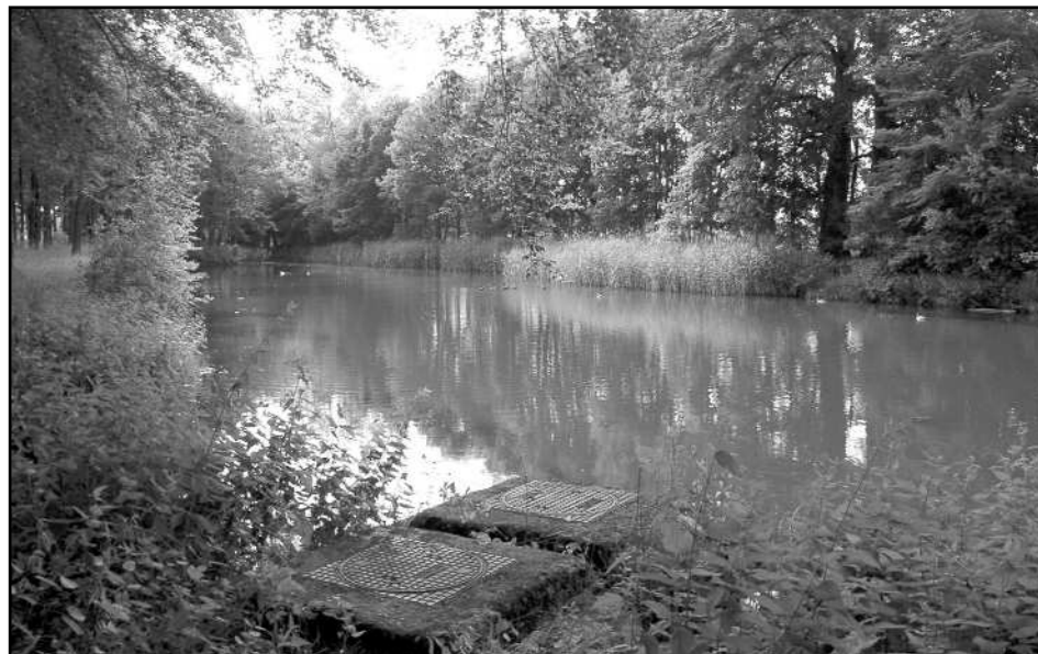
Bij een hevige regenbui wordt rioolwater in een vijver geloosd.

water dat op straat valt. Dat regenwater wordt naar de dichtstbijzijnde beek of vijver getransporteerd en daar in de vijver geloosd of vlak bij de beek geïnfilteerd. Tegelijkertijd worden regenpijpen niet meer op de riolering aangesloten, maar monden zoveel mogelijk uit in tuinen of in de grond, rechtstreeks of bijvoorbeeld via een grindbak. De overstorten van het rioleringsstelsel komen niet meer uit in vijvers, maar in speciale bezinkbassins die hier en daar ondergronds worden aangelegd. De vervuilde vijvers worden vervolgens uitge-