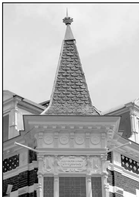
Het hoekpand Hoofdstraat-Deventerstraat

van de jaren negentig van de vorige eeuw, tot de toenmalige eigenaar De Lange zijn zaak sloot. In het interieur zijn nog authentieke bovenlichten aanwezig met glas-in-lood waarop gebundelde sigaren zijn afgebeeld. De panden zijn een duidelijk en overtuigend voorbeeld van de bouwkundige ontwikkelingen in het tweede kwart van de 19de eeuw die onder andere bepaald werden door de neorenaissance.