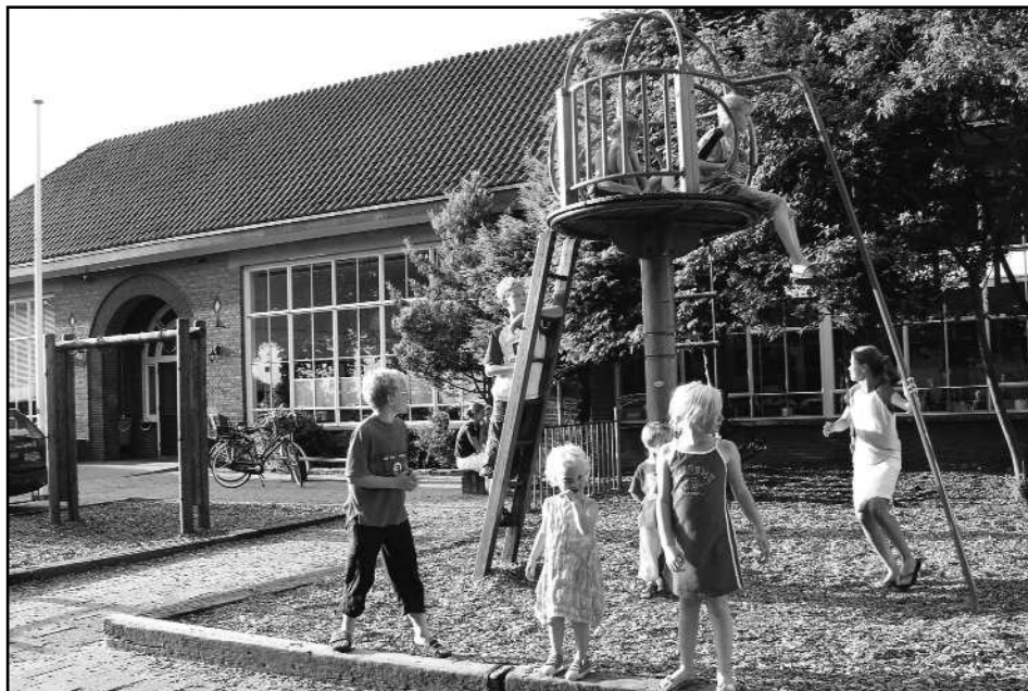
De Eben-Haëzerschool in Teuge moet wegens de voortdurend stijgende leerlingenaantallen weer uitbreiden. Er komt een locatie in Apeldoorn.