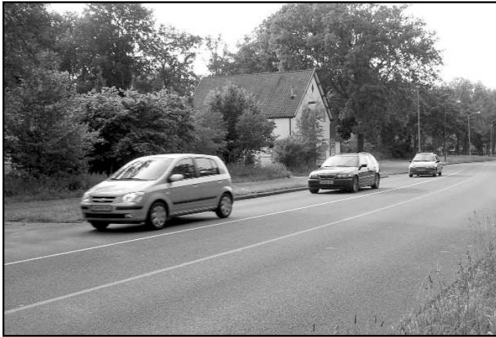
Op deze locatie aan de Kayersdijk komt mogelijk de vestiging van de Eben-Haézerschool in Apeldoorn