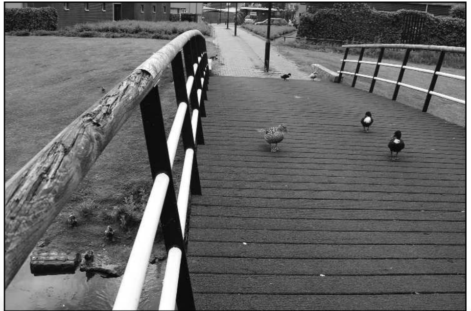
Losliggende stoeptegels, kapotte brugleuningen en andere klachten kunnen worden gemeld bij de Buitenlijn.

De Buitenlijn is zo'n succes dat Apeldoorn er mee de boer op gaat. Wethouder Eppo Gutteling (PvdA) mag collega's en raadsleden uit het land graag vertellen over de